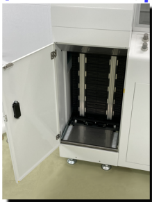
マガジンラック投入部