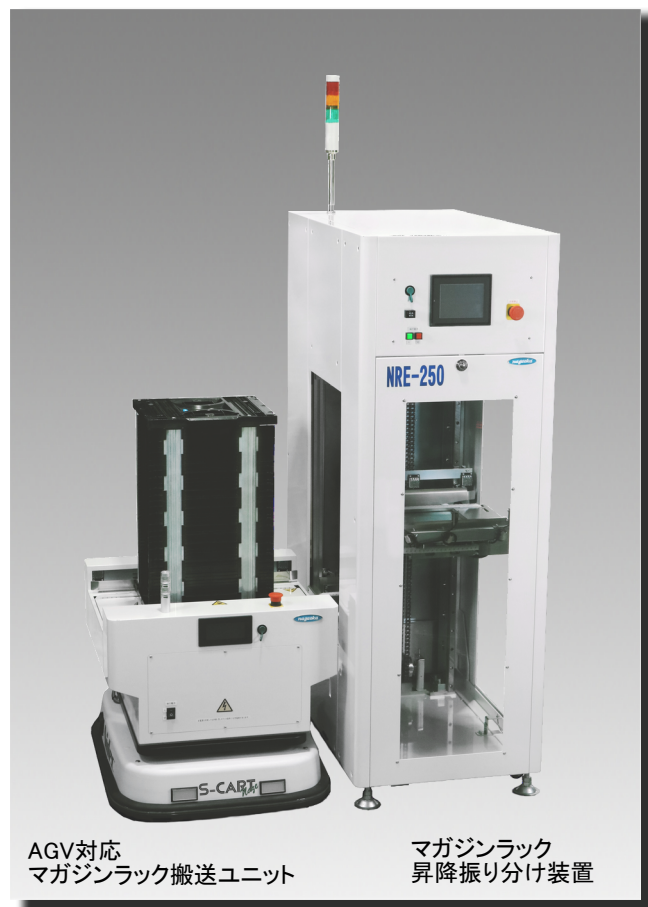
AGV対応 マガジンラック搬送ユニット